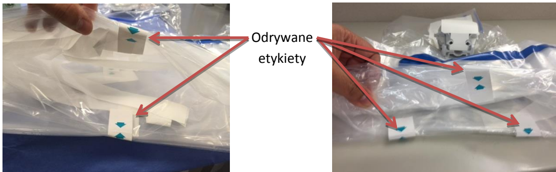
Obłożenie ramienia narzędzia