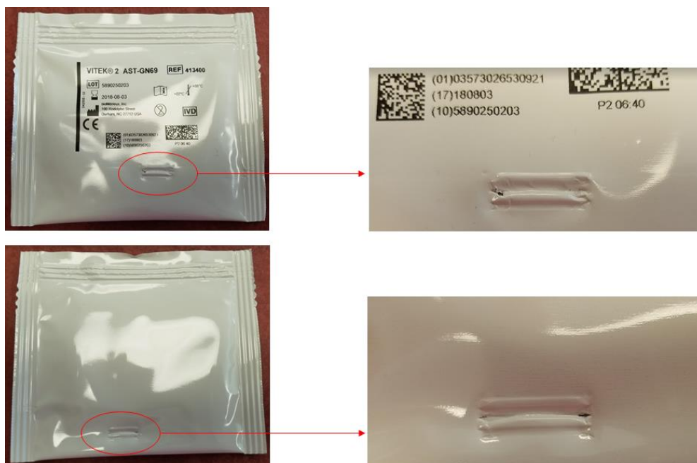
Rysunek 1 – przykład uszkodzenia opakowania

Zidentyfikowano główną przyczynę powyższego problemu oraz podjęto stosowne działania w celu zapewnienia braku wpływu na przyszłe serie produktu.