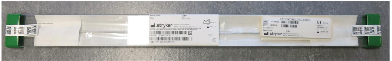
Przykład opakowania - sterylna torebka wewnątrz przezroczystej (plastikowej) tuby