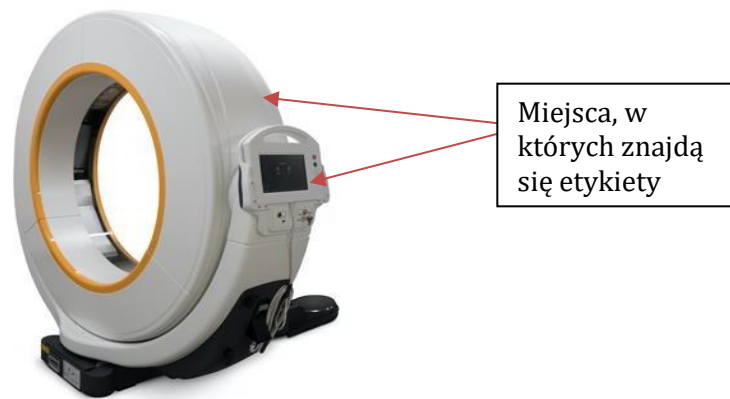
Rysunek 2 – Ilustracja wskazująca, gdzie zostaną umieszczone etykiety