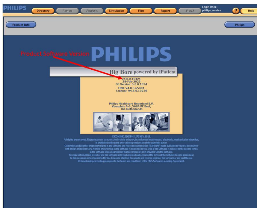
Ilustracja 2. Przykład wyświetlonej wersji oprogramowania systemu Big Bore