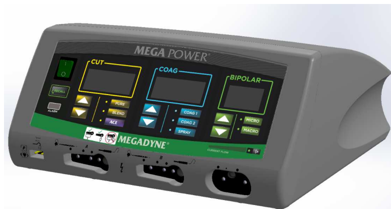
Rycina 3. Umieszczenie etykiety (nowa płyta czołowa)