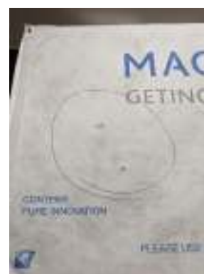
Zdjęcie 3: przykłady dziur w pokrywie Tyvek