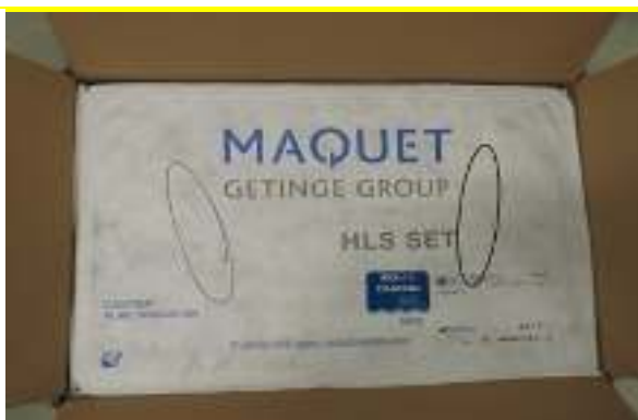
Zdjęcie 2: położenie potencjalnych uszkodzeń po lewej lub prawej stronie, w zależności od położenia Modułu HLS w opakowaniu