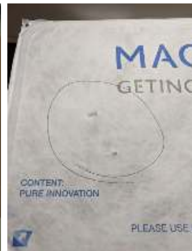
Zdjęcie 5: Typowy wygląd uszkodzenia