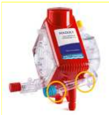
Zdjęcie 1: obydwa zaczepy uchwytu sondy żylniej w module HLS

Firma Maquet Cardiopulmonary GmbH (MCP) otrzymała reklamacje od klientów dotyczące uszkodzenia podstawowego opakowania zestawu HLS Advanced. We wszystkich skargach klientów zgłaszano uszkodzenie pokrywy Tyvek. Wygląd uszkodzenia opakowania sugeruje dziurę lub dziury w Tyvek. Uszkodzenia są spowodowane zaczepami uchwytu głowicy żylniej wewnątrz opakowania (zdjęcie 1). W związku z tym, w zależności od położenia modułu HLS w opakowaniu, mechaniczne uszkodzenia/małe otwory mogą pojawić się po lewej lub prawej stronie Tyvek (zdjęcia 2 i 3), które odpowiadają położeniu uchwytu sondy żylniej.