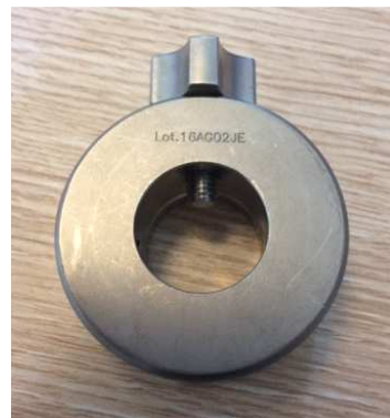
Rysunek 3: podzespoły produktu 9057.20.555: dwa pręty osiujące (po lewej) i prowadnica (po prawej).

Przy okazji przypominamy, że wklonowanie ubijaka-pozycionista-prowadnicy należy przeprowadzać w osi z korpusem instrumentu. Generowanie obciążeń wieloosiowych w trakcie oddziaływania na instrument może w znaczący sposób przyczynić się do spowodowania pęknięć instrumentu w miejscu spawania.