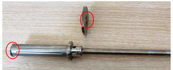
Rysunek 1: możliwe błędy spawania.