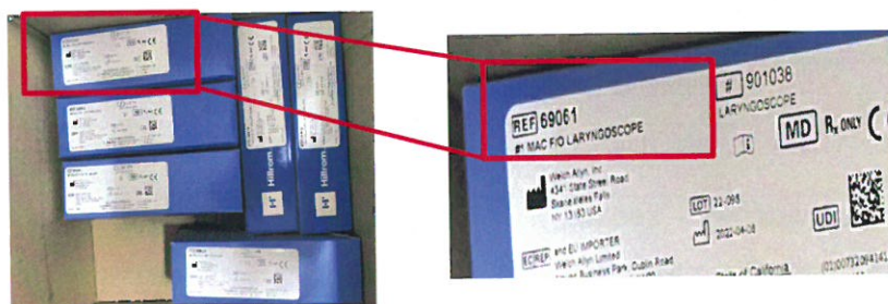
Rys. 2. Zestawy laryngoskopów światłowodowych (kod produktu 69696 i kod produktu 69696-LED )