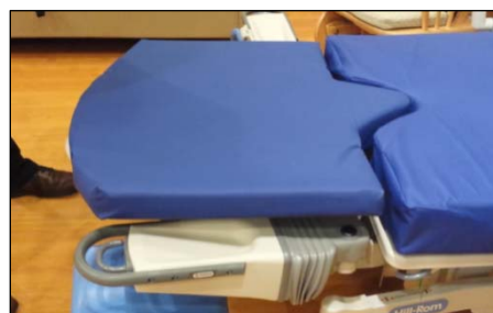
Część podnoszona sekcji stóp

Firma Hill-Rom pragnie przypomnieć użytkownikom o prawidłowym postępowaniu z częścią podnoszoną sekcji stóp, zgodnym z instrukcją łóżka porodowego Affinity™ Four. Nieprawidłowe postępowanie, na przykład umożliwianie wielokrotnego upadku sekcji stóp, może spowodować wygięcie mechanizmu blokady. Znaczące wygięcie mechanizmu blokady może ewentualnie spowodować niewłaściwe zaczepianie sekcji stóp o łóżko. Mogłoby to doprowadzić do urazu użytkownika na skutek upadku, gdyby uszkodzona sekcja stóp uległa odłączeniu w trakcie użytkowania. Do takich sytuacji dochodzi rzadko (nasze dane wskazują, że zdarza się to 2,8 razy na milion działań) i można ich uniknąć dzięki prawidłowej obsłudze sekcji stóp oraz nie dopuszczając do jej wielokrotnego upadku na podłogę. Produkt pozostaje bezpieczny, dopóki nie zostanie uszkodzony.