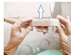
Rysunek 1 Udoskonalone uszczelnienie pokrywy

Uwaga: Jeśli występuje uszczelnienie oryginalne i konieczne jest uzyskanie widocznej czystości, można skontaktować się z działem biomedycznym lub serwisantem firmy GE Healthcare w celu demontażu i późniejszego montażu uszczelnienia