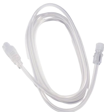
Rys. 1: zdjęcie produktu

Oznaczenie wyrobu: PN-MDX3515M – numer katalogowy Guerbet: 240004 Opis: 150 CM PRZEWÓD PRZEDŁUŻAJĄCY/INIEKCYJNY PROSTY TK/RM Numer partii: por. załącznik