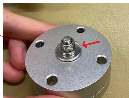
Ilustracja 2. Zespół łącznika obrotowego z metalową podkładką