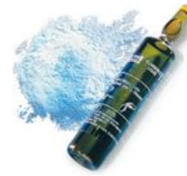
Zdjęcie 2: Ampułka z proszkiem i monomerem cementu kostnego Refobacin Bone Cement

Firmę Zimmer Biomet poinformowano o zwiększeniu stężenia histaminy w gentamycynie zawartej w określonych partiach cementu kostnego i Optipac. Histamina jest normalnym zanieczyszczeniem w procesie wytwarzania gentamycyny.