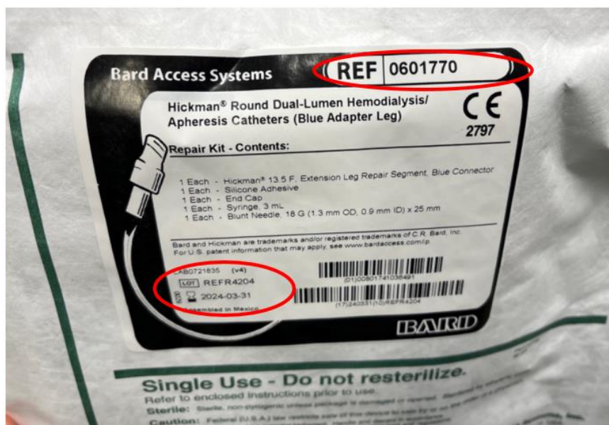
Rysunek 2: Kod produktu, numer partii (Lot) i data ważności na torebce