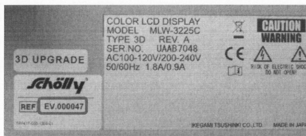
Rysunek: Tabliczka znamionowa na tylnym panelu monitora.