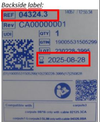
Ryc. 1 Identyfikacja potencjalnie wadliwego produktu na podstawie REF i daty ważności na etykiecie za pomocą daty 2025-10-13 lub wcześniejszej (dla przykładu patrz czerwone ramki, REF 05120.1 reprezentuje również REF 05120.3, oba wstępnie połączone w torebkach i REF 04324.3 w twardej pudełku).