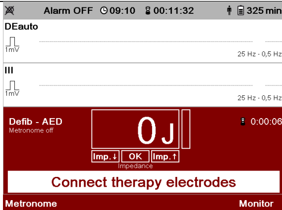
Ryc. 2 Komunikat „Podłącz elektrody terapeutyczne” (Connect therapy electrodes) corpuls1