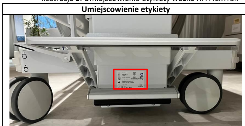
Ilustracja 2. Umieszczenie etykiety wózka HA FlexTrak

Etykieta identyfikacyjna wózka HA FlexTrak znajduje się po stronie uchwytu, pod pedałem hydraulicznym, jak pokazano na ilustracji 2.